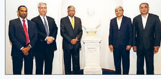
नोएल टाटा की अध्यक्षता में हुई बैठक टाटा ट्रस्ट्स ने एक बयान में कहा कि बाई हीराबाई ट्रस्ट के न्यासियों के बोर्ड की बैठक 17 अप्रैल, 2026 को टाटा ट्रस्ट्स के चेयरमैन नोएल एन टाटा की अध्यक्षता में हुई। बैठक में ट्रस्ट की गतिविधियों की समीक्षा के साथ ही मीडिया में ट्रस्ट से संबंधित हालिया बयानों पर चर्चा की गई।