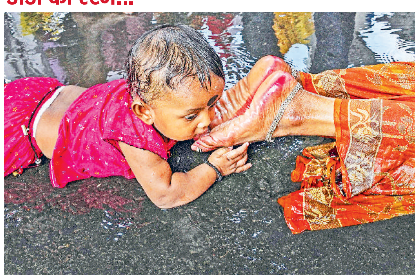
कोलकाता। कालीघाट इलाके में शीतला पूजा के मौके पर शनिवार को एक मंदिर तक पहुंचने के लिए सड़क किनारे लेटकर डोंडी की रस्म करती मां और बेटा।